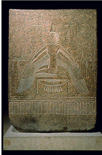
La diosa Isis, , detalle del sarcófago de Ramsés III, granito rosa, Reino Nuevo, Dinastía XX, Museo del Louvre